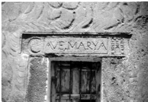
Dintel en la antigua casa de los Luna y Mendoza, en Castillo de Bayuela, con los emblemas grabados de ambas casas nobiliarias. Desaparecido.