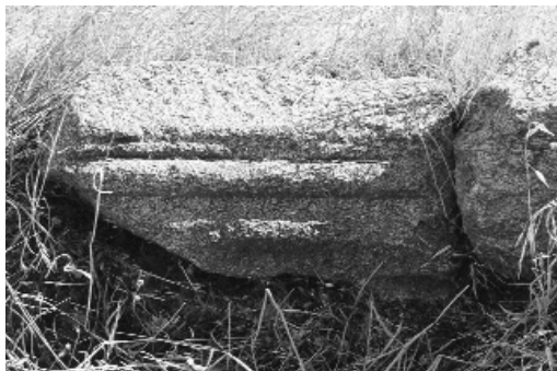
Fragmento de sillar labrado y decorado perteneciente al Cuarto de la Casa de los Luna y Mendoza. Propiedad particular.

que se corrieron por agosto" 54 . Y, por último, en 1753 aún seguían siendo propiedad de los Duques de Palma según constan en las respuestas al Catastro del Marqués de la Ensenada 55 .