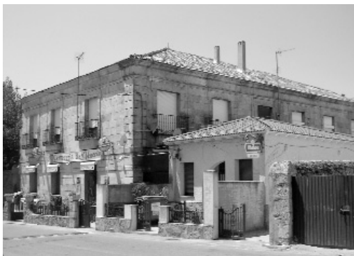
Edificio parcialmente conservado del palacio del marqués de Navamorcuede (1697) hoy de propiedad privada.