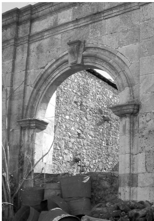
Arco de acceso al palacio del marqués de Navamorcuede (1697) mencionado en la documentación del contrato.

antes de producirse estas cuestiones, el 8 de enero de 1697 ya existía un concierto con Pedro Moncayo, vecino de Arenas de San Pedro (Ávila), para traer diversas cantidades