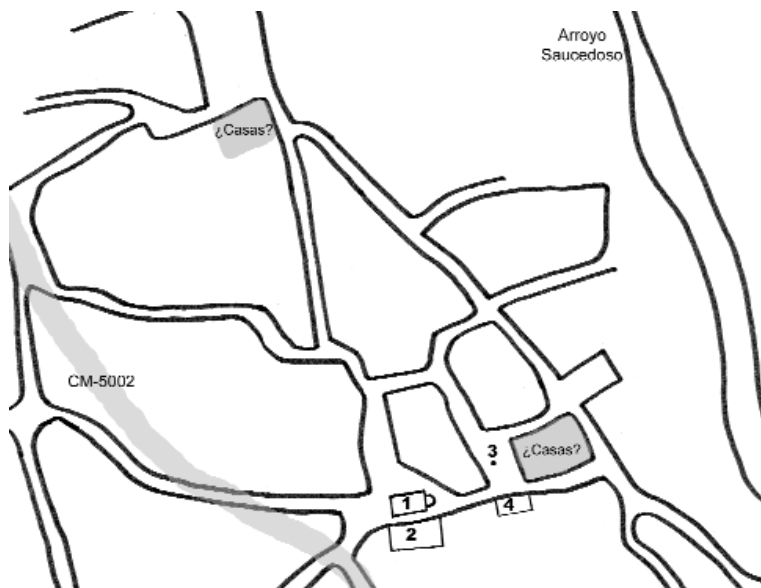
Plano de las calles y caminos antiguos de la villa de Cardiel y la posible ubicación de las casas del marqués de Navamorcuende (1.- Iglesia de Santiago Apóstol; 2.- Cementerio; 3.- Plaza pública y Rollo del siglo XVI; 4.- Panera)