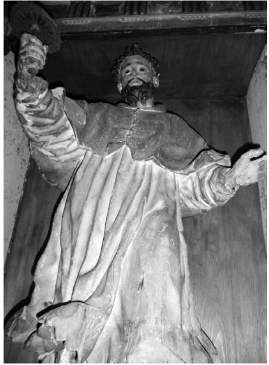
San Ramón Nonato (Parroquia de Nombela)

-Un San Ramón Nonato, de tamaño natural con vestiduras duras y rígidas que nos recuerdan al San Peregrín de Talavera. Todas estas obras conservan una policromía y estado muy deteriorados y necesitan restauración.