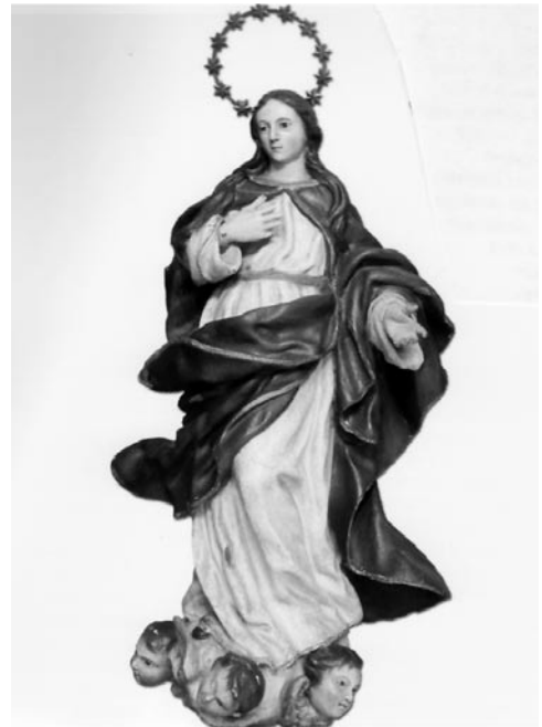
Virgen de la Inmaculada. Arriba, parroquia de Nombela. Abajo, anónimo del siglo XVIII (posiblemente de José Zazo), Basílica del Prado