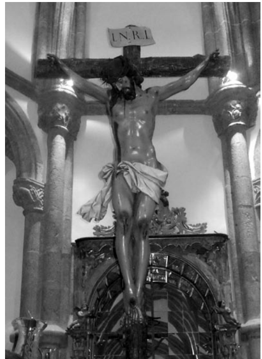
Cristo de los Espejos (Capilla de la Colegiata de Talavera de la Reina)