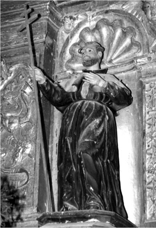
San Francisco Javier (Parroquia de Nombela)

central del magnífico retablo plateresco, obra de Giraldo de Merlo, de 1618. Es la patrona de dicha iglesia llamada Asunción de Nuestra Señora. Lo más destacado de esta talla, de tamaño natural, son las figuras de los angelitos que flotan a sus pies, de caras juguetonas y muy realistas (nos recuerdan a los de la Inmaculada anónima de Talavera). La figura, con el brazo derecho lanzado hacia delante, tiene la mirada clavada dirigida hacia el cielo. Gracias al ondulado de sus vestiduras da la sensación de estar levitando en el aire. De la cabeza destaca el velo y el rostro lleno de ternura. Una corona cubre la cabeza y es muy similar a la de la Inmaculada anónima citada anteriormente (con doce estrellas como dice el Apocalipsis 12,1).