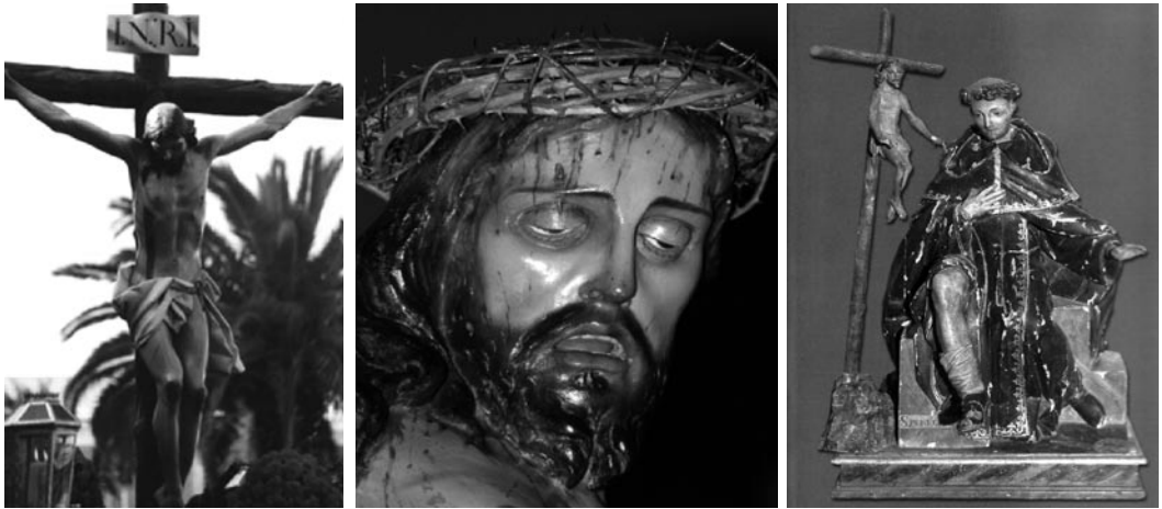
De izquierda a derecha: Cristo de la Espina y detalle (Parroquia del Salvador de Talavera de la Reina). San Peregrín (Basílica del Prado de Talavera de la Reina)

referimos al Cristo de la Espina. Situado en una de las capillas de la parroquia de El Salvador y de disposición parecida al Cristo de los Espejos, pero mucho más esbelto y de proporciones más hermosas y elegantes, nos recuerda más al Cristo de la sacristía de Nombela. Se le conoce así por la espina clavada que le atraviesa la ceja derecha. Su contemplación denota el riguroso conocimiento anatómico y sentido espiritual de José Zazo, que alcanza su culmen en esta preciosa talla, que podríamos considerar una de las esculturas más destacadas del siglo XVIII (actualmente se encuentra en La Colegiata).