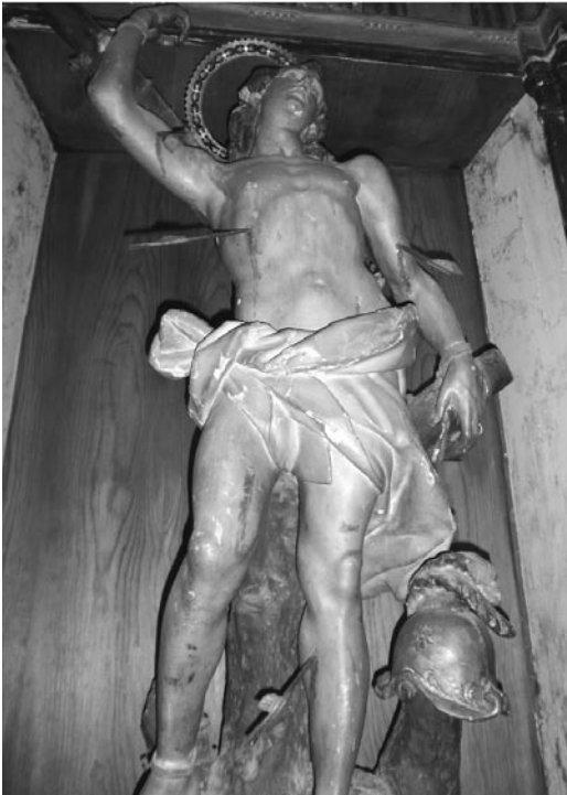
San Sebastián (Parroquia de Nombela)

-Un bello San Sebastián, atravesado por varias flechas, con paño rígido y apoyado en un tronco, con un casco al lado de su pierna izquierda... Resalta la profundidad y abultamiento del ombligo, rasgo identificativo de sus esculturas desnudas.