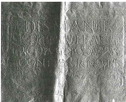
Fig. 3. Epígrafe de Primillae, CIL II, 4519. Calco en la Real Academia de la Historia.

4. Un epitafio dedicado a Uralo es interpretado generalmente de acuerdo con la lectura que ofreció el Padre Fidel Fita, y que recogió después Hübner 26 . No obstante, la terminación en A del nombre masculino PENTILI no parece muy lógica. El conde de Cedillo analizó personalmente el epígrafe, que describe como efectuado en soporte de piedra berroqueña muy basta, y hace una lectura algo diferente, pero que cambia sustancialmente el texto 27 .