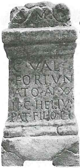
Fig. 4. Ara sepulcral de Caio Valerio Fortunato, fallecido con 22 años.

texto necesita corrección. Aparece en Fuidio con el nombre de Evohe 30 . En realidad su texto es el siguiente 31 :