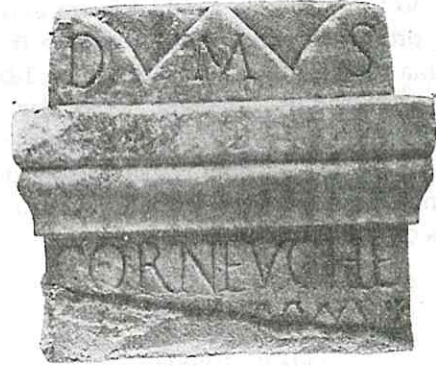
Fig. 5. Ara de Cornelia Evche.

D(is) M(anibus) TONGIITA MVS RII BVRRINI