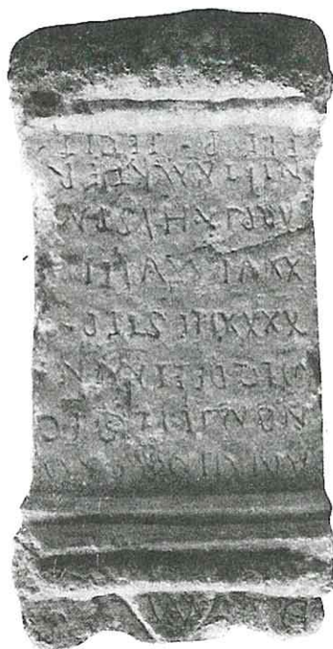
Fig. 6. Epígrafe del veterano de la Legio VII.

Dimensiones: 0'39 metros de alto por 0'22 de ancho.