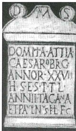
Fig. 2. Inscripción del ara sepulcral romana de Domitia Attia (CIL II, 897).

Este ejemplo, recogido en un ara sepulcral de mármol, de una magnífica calidad (fig. 2), recoge la mayor parte de la información que usualmente aparece en un epitafio romano. Si en la antigüedad se hubiera puesto epitafio a todas las personas, ni mucho menos fue así, y si los mismos se hubieran conservado, fenómeno imposible por otra parte, hoy podríamos tener un elenco de relaciones sociales y familiares. En todo caso, Domitia Attia for-