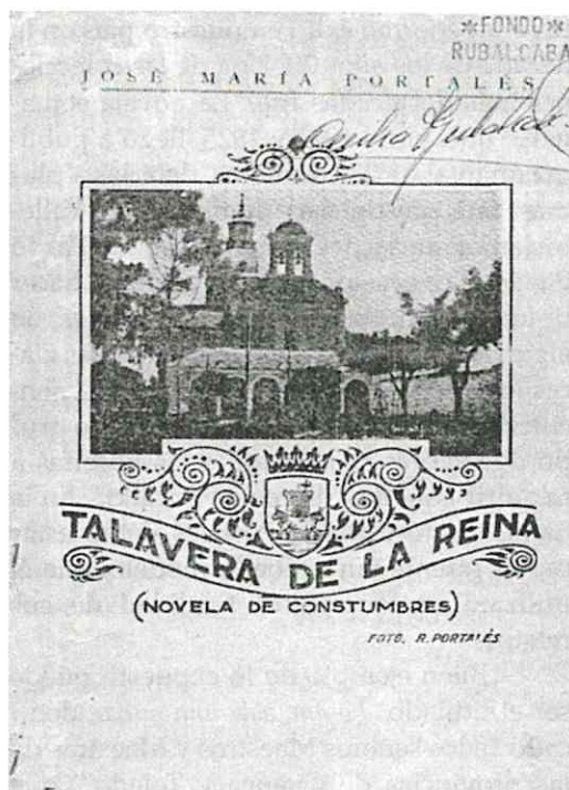
Portada de Talavera de la Reina (Novela de Costumbres).

Como se desprende del título, dos son los protagonistas de la pieza: de un lado, los jóvenes estudiantes universitarios; de otro, las hacendosas y despreocupadas modistillas. Éstas sueñan con futbolistas, aviadores o toreros como futuros maridos.